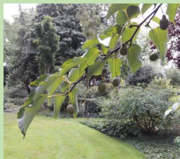
Zakdoekjesboom ( Davidia involucrata )

Al met al was het opnieuw een geslaagde wandeling – zeker voor herhaling vatbaar!