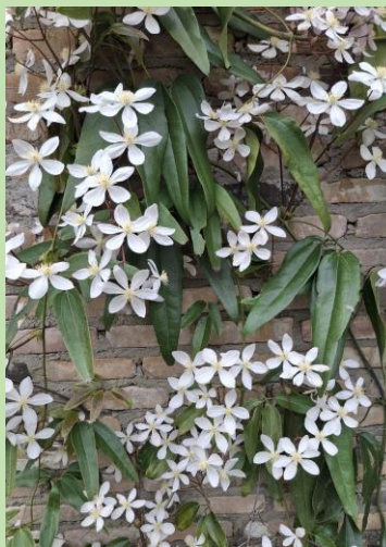
Clematis arandii 'Apple Blossom'

Er is volop gesnoeid, gehakt, gezaagd en geveegd. Inmiddels zijn de eerste maaibeurten van het nieuwe seizoen alweer uitgevoerd en liggen de gazons er weer strak bij. Ook de knotwilgen zijn om en om gesnoeid. Deze jaarlijkse snoei voorkomt dat de bomen topzwaar worden en bij harde wind scheuren of omwaaien. Bovendien heeft dit onderhoud een belangrijke ecologische functie: de holtes in de knot vormen ideale nestplaatsen voor vogels, zoals de steenuil, en bieden onderdak aan insecten en kleine zoogdieren.