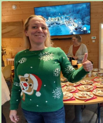
Helemaal in kerstsfeer!