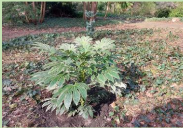
De nieuwe Fatsia en daarachter de Japanse den